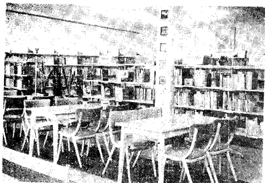
WYPOŻYCZALNIA DLA DZIECI