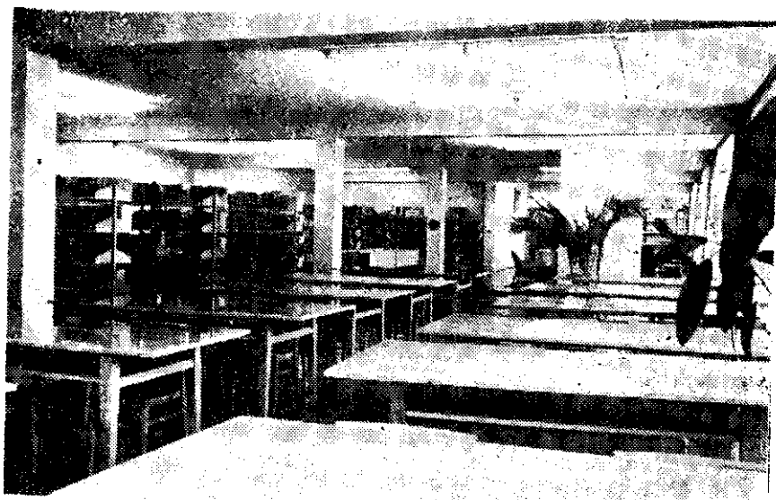
CZYTELNIĄ DLA DOROSŁYCH