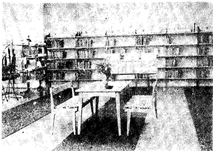
CZYTELNIA DLA DZIECI